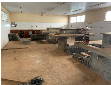
Figura 7 - Laboratório