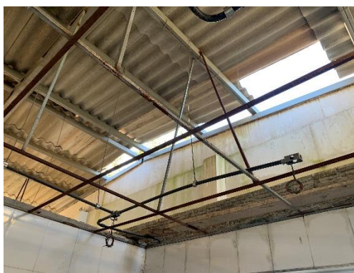
Figura 11 – Entarugamento metalico do BHO