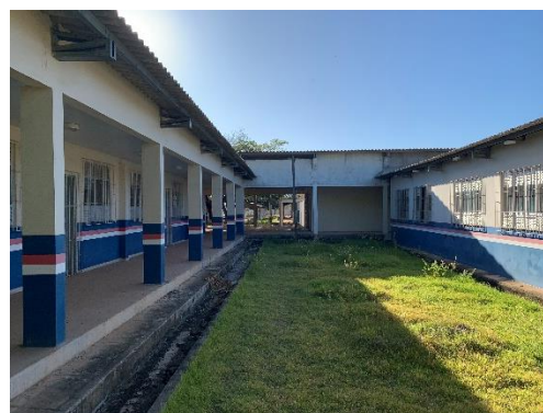
Figura 13 – Blocos Pedagógicos