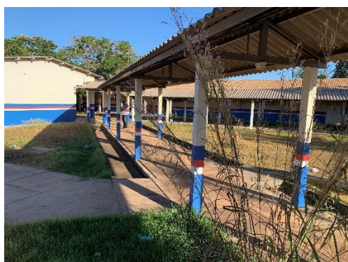
Figura 4 – Circulação de entrada