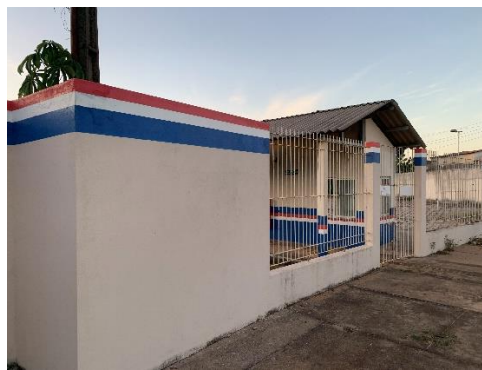
Figura 3 - Entrada da unidade escolar