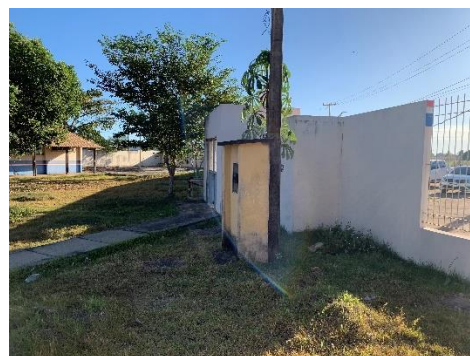
Figura 5 – Lixo e alimentação de entrada