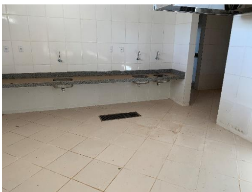
Figura 10 – Cozinha