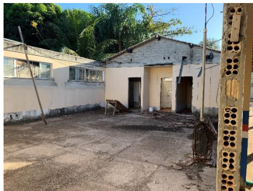
Figura 9 – Sala multiuso inacabada