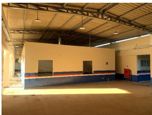
Figura 6 - RCO