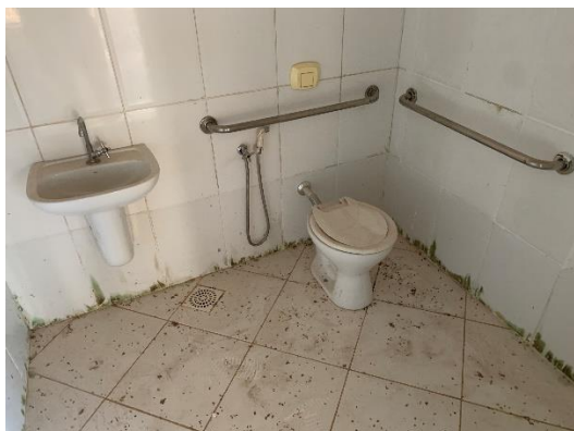
Figura 8 – Bho PCD