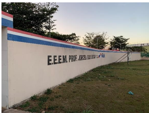
Figura 2 - Fachada Principal da Escola