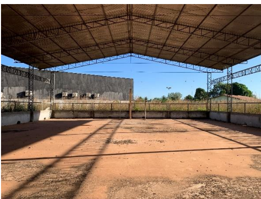
Figura 12 – Quadra